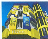
CASA CENTRAL Benigno González N° 250 Tel. / Fax: 643 596 (R.A.) 643 997 - 647 222/3 - 649 541 650 688 - (0981) 896 760 (0971) 357 080 - (0951) 805 090

Personería Jurídica Dto. 1170 del 21/VI/1989 Registro N° 37 - INCOOP