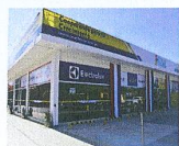
SUCURSAL 1 Fernando de la Mora, esq. Luis A. de Herrera - Luque Tel. / Fax: 644 105 / 655 081